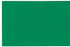
C-09フォレストグリーン (透光率0%)