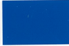
C-01ロイヤルブルー (透光率0%)