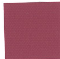
V-05:バーガンディ [透光率0.66%]